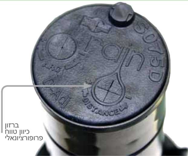
ברזון כיוון טווח פרופורציונאלי