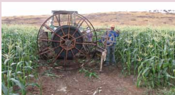
Maquina Hidraulica de recolección. Tambor de 2.0 mts

Nuestro sistema es totalmente mecanizado en lo que respecta a la colocación y recuperación de la línea de goteo.