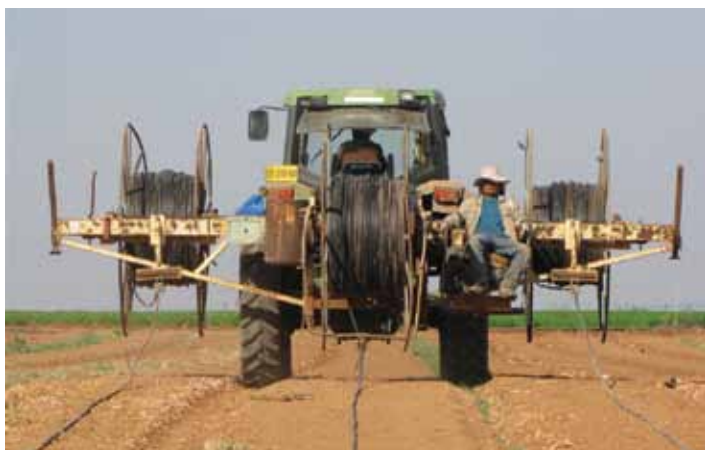
Desplegado de las mangueras 13,000-20,000m

pequeño carrete de cartón o mediante un gran carrete metálico, en función del tipo de línea de goteo y de los requerimientos del cliente, mediante una maquinaria adecuada para el enrollado y desenrollado.