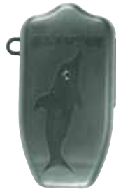
Estuche de protección