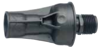
אל נגר 3/4